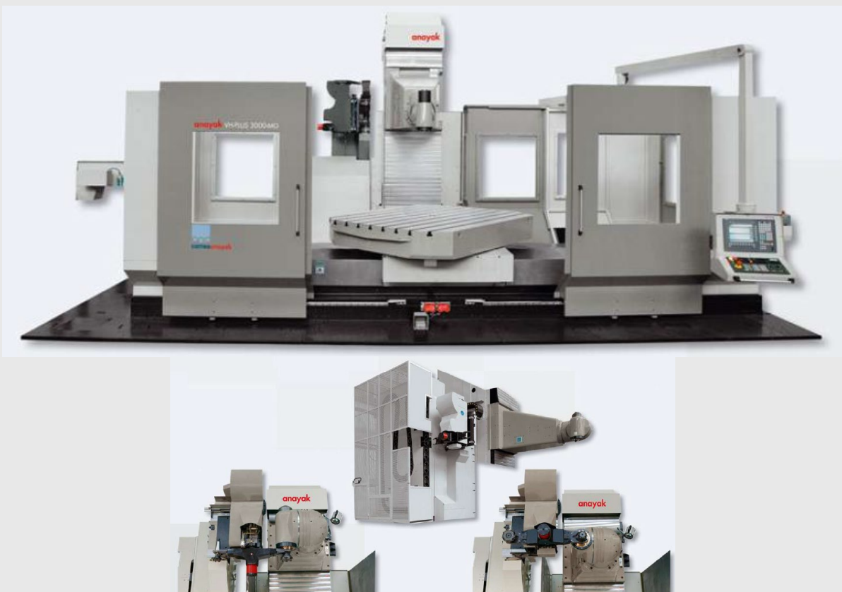
Ejemplo de fresadora CORREANAYAK VH-Plus 3000 después de su reconstrucción