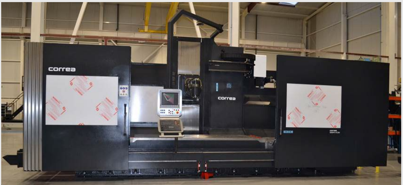
CORREA CF25/25 con nuevo ATC-30 y opción de nuevo cabezal automático (UDG)